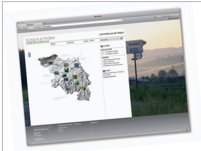
Die «Schulplattform Oberaargau» ist nun online.

Die Themen werden in insgesamt 15 verschiedenen Unterrichtsmodulen abgehandelt, die modular und alle nach dem gleichen Prinzip aufgebaut sind. Zu jedem Modul sind aber auch Arbeitsblätter erstellt worden und stehen weitere Ressourcen (Karten, Bilder, Videos, Links, etc.) zur Verfügung. Die professionell aufgemachte Website enthält auch ein interessantes Quiz, bei dem nicht nur Lehrpersonen und Schüler, sondern alle